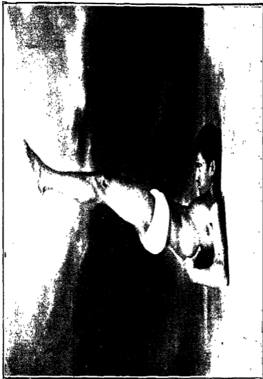
सर्वोंगासन (सिक्खा दस्य) मनोरजन प्रेस, मुंबई ४.